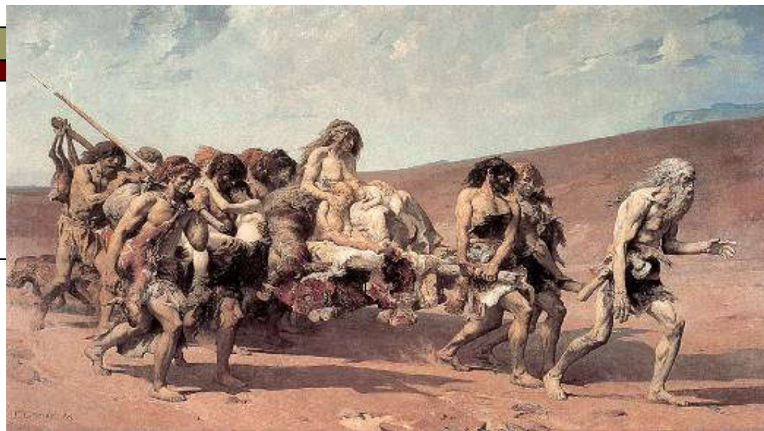
Fernand Cormon (1880), Kajin u zemlji Nod, Paris