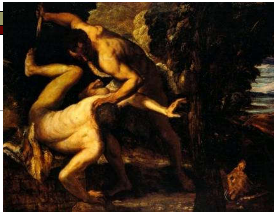
Tintoretto 1518 – 1594, Kajin i Abel; Ulje na platnu (149 × 196 cm) — 1550-53