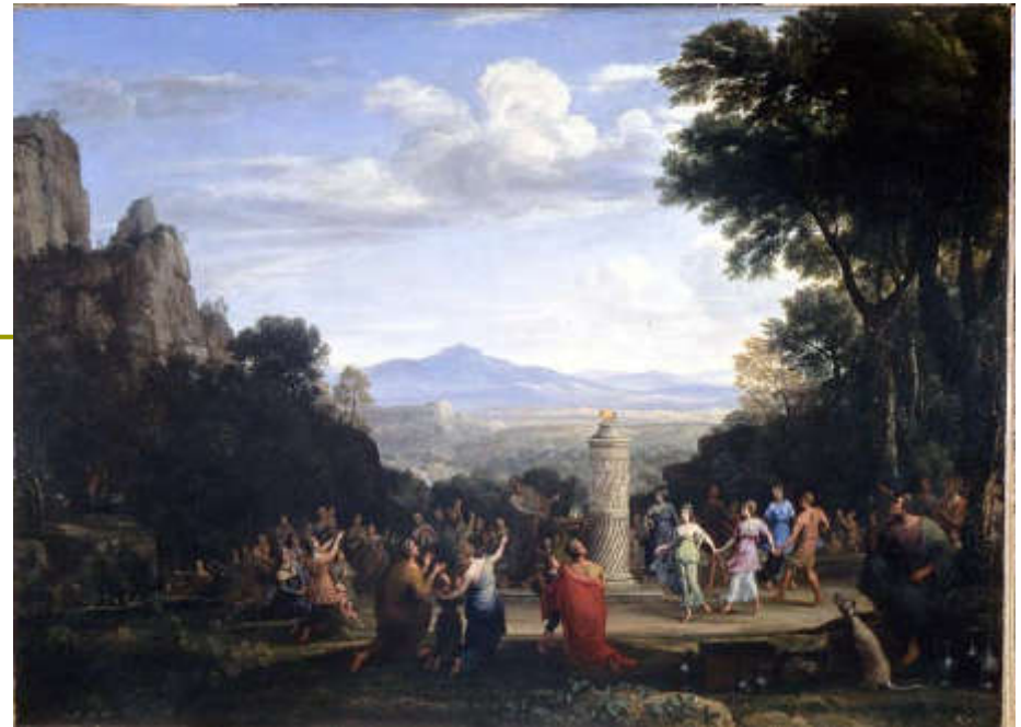
Lorrain Claude, Klanjanje zlatnom teletu, 1660.