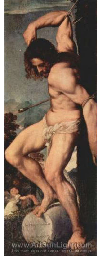
Tician, Sv. Sebastian