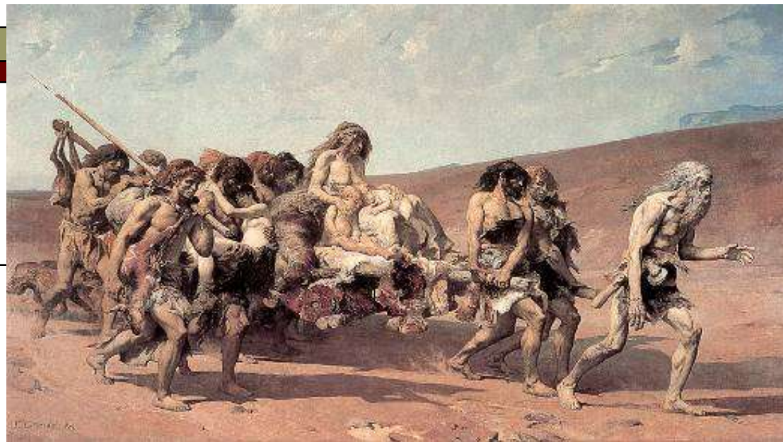
Fernand Cormon (1880), Kajin u zemlji Nod, Paris