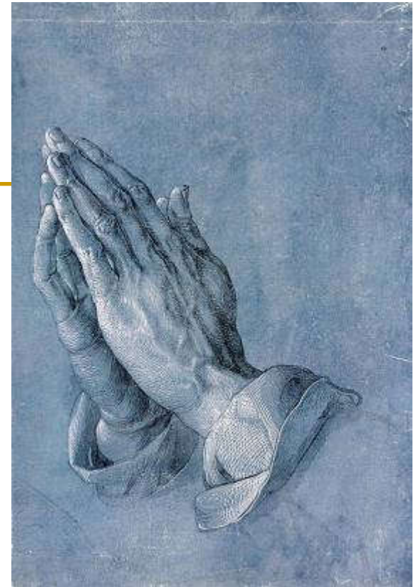
Albrecht Dürer, Betende Hände

Čovjek u razgovoru s Bogom Ne samo Psalmi