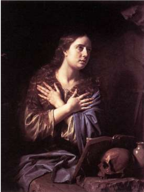
Philippe de Champaigne, Magdalena pokornica, Museum of fine Arts, Houston