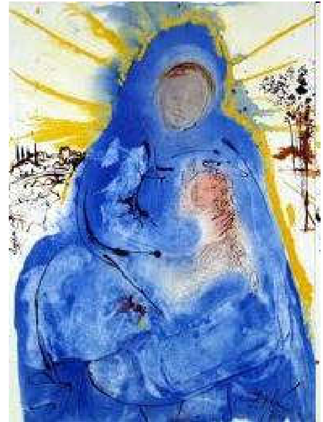
S. Dali: Djevica će roditi sina