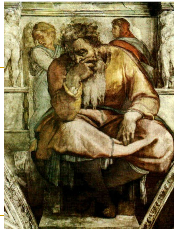
Michelangelo, Jeremija, Sikstinska kapelica