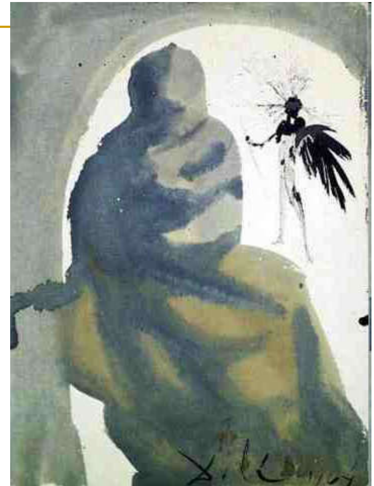
S. Dalí, Seduxisti me, Domine (1964.-67.)