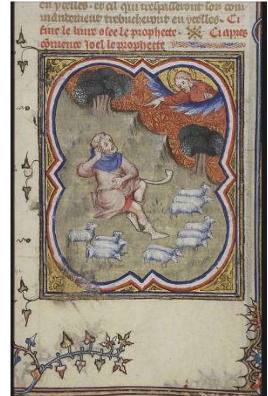
Amos as shepherd, Illustrator of Petrus Comestor's 'Bible Historiale', France, 1372 ; Miniature, Museum Meermanno Westreenianum, The Hague