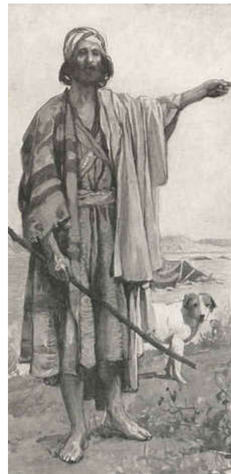
James Tissot The Prophet Amos watercolour — ca. 1888