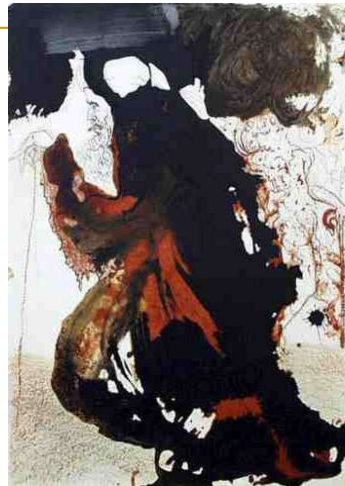
S. Dali, Am 7,7: U ruci mu visak, "Biblia Sacra", 1969 by Rizzoli of Rome