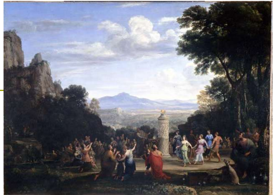
Lorrain Claude, Klanjanje zlatnom teletu, 1660.