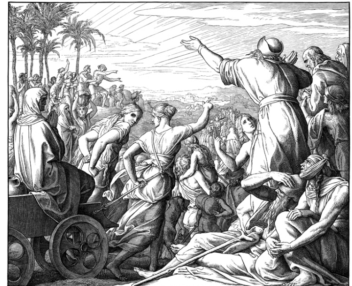
Die Rückkehr aus der babylonischen Gefangenschaft. Da machten sich auf die oberen Hüter aus Juda und Benjamin, und die Weiser und Weisen, alle deren Geist GOTT erweckte, hinauf zu ziehen und zu bauen das Haus des HERRN zu Jerusalem. Wied. Bibl. Kap. 1. v. 5.