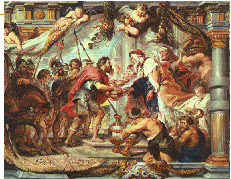
Peter Paul Rubens, Susret Abrama i Melkisedeka, (1625)