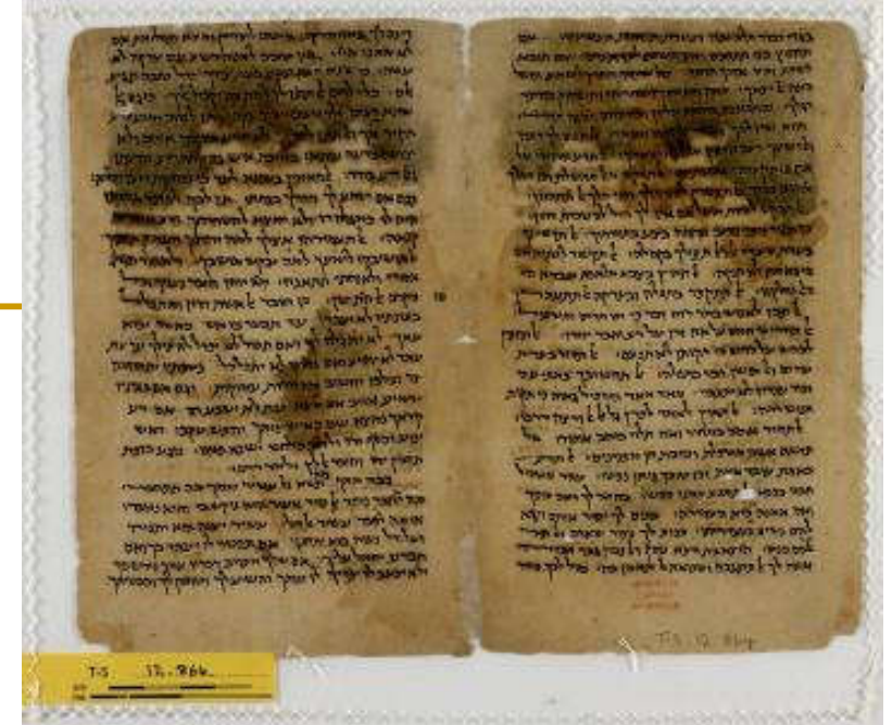
Odlomak na hebr. Sir 5,10–7,29; 11,34–14,11 u Cambridgeu