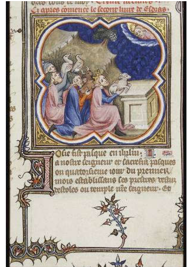
Minijatura, Petrus Comestor, Bible Historiale, Francuska, 1372