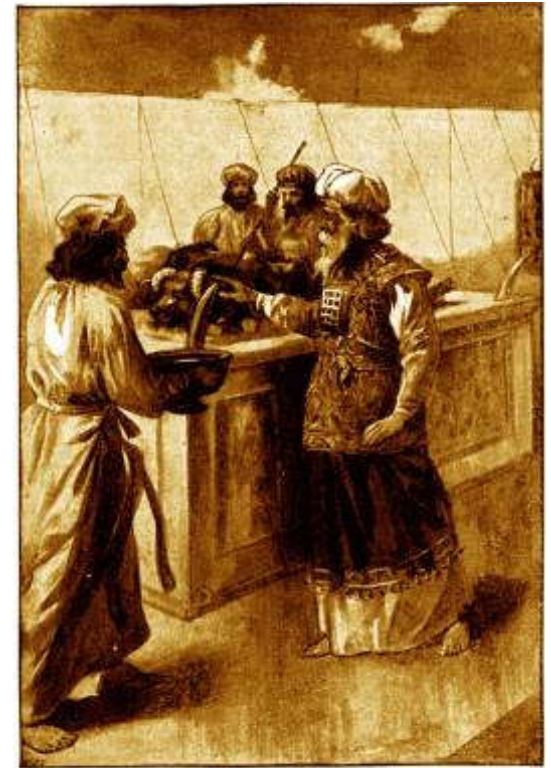
AARON AND HIS SONS PREPARING A BURNT SACRIFICE—LEV. 1 and 10: 11.